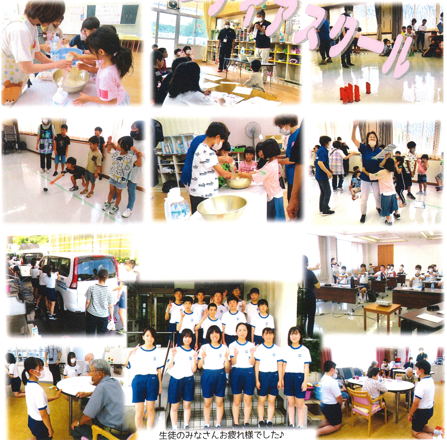
生徒のみなさんお疲れ様でした♪

さまざまなことに興味を持ち、体験学習する中から、福祉に関する理解を深め、自分から進んで活動できる心を育むことを目的にこの事業を実施しています。