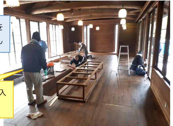
体験村再開に向けて手入れをする有志の皆さん