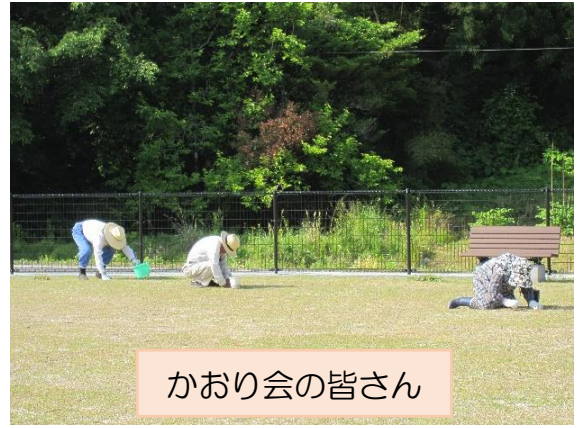
かおり会の皆さん