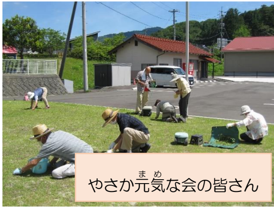
やさか まめ 元気な会の皆さん