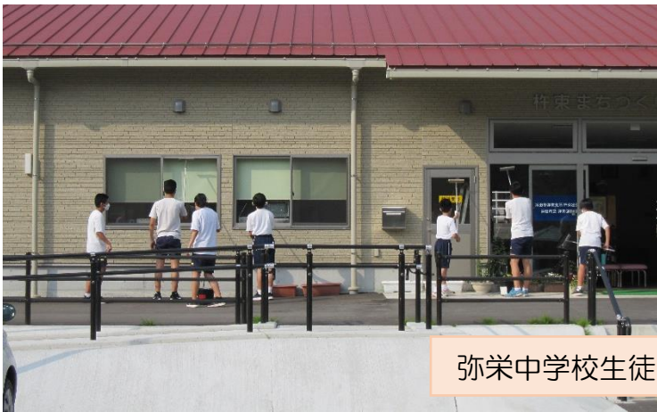
弥栄中学校生徒・職員の皆さん