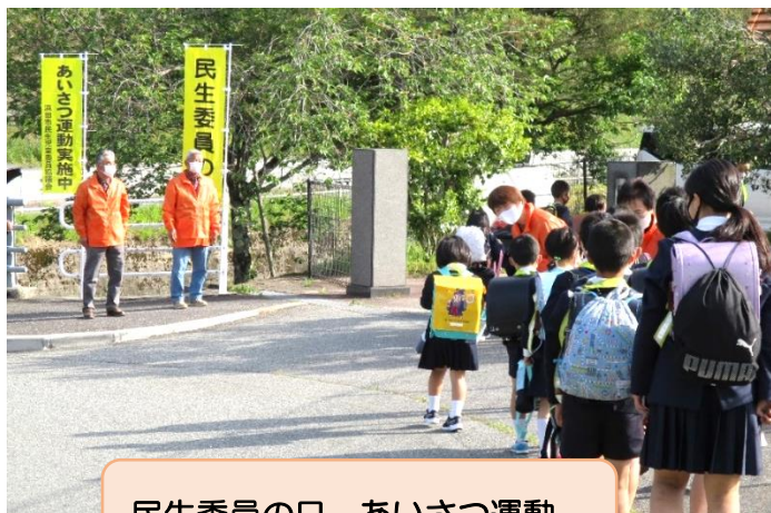
民生委員の日 あいさつ運動