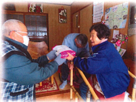
民生委員さんよりお届け↑