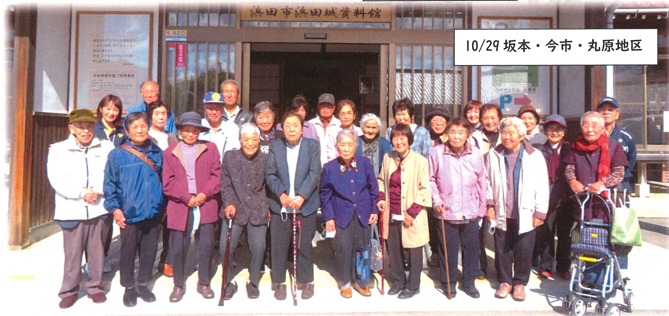
10/29 坂本・今市・丸原地区