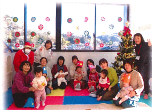
子育てサロンクリスマス会の様子↓

募金活動にご協力いただきました皆様に深く感謝申し上げます。ありがとうございました。