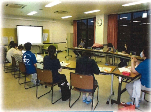
福祉委員研修会の様子↑

※集められた赤い羽根共同募金は、次年度の福祉教育活動、地区社協の活動、福祉委員活動、一人暮らし高齢者サポート事業等に助成されます。