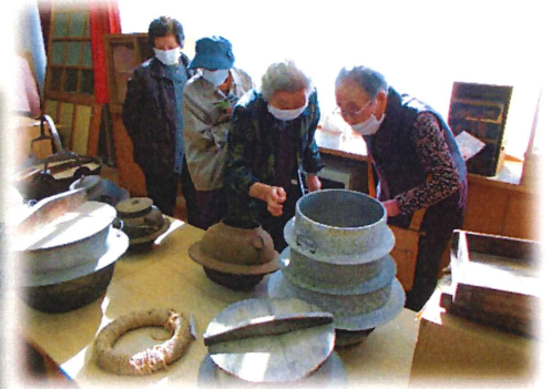
一人暮らし高齢者サポート事業の様子↑