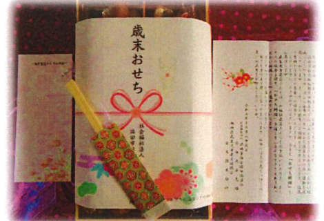
旭中学校生徒からのお手紙を添えて↓