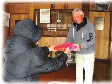
民生委員さんよりお届け↑