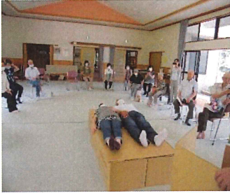
防災 (ダンボールベット作り)