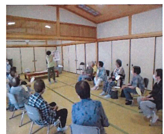
歯科衛生士さんのお話