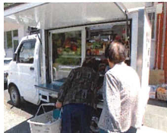
サロンでお買物 (まんてん)