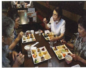
お買物と菜の華で昼食