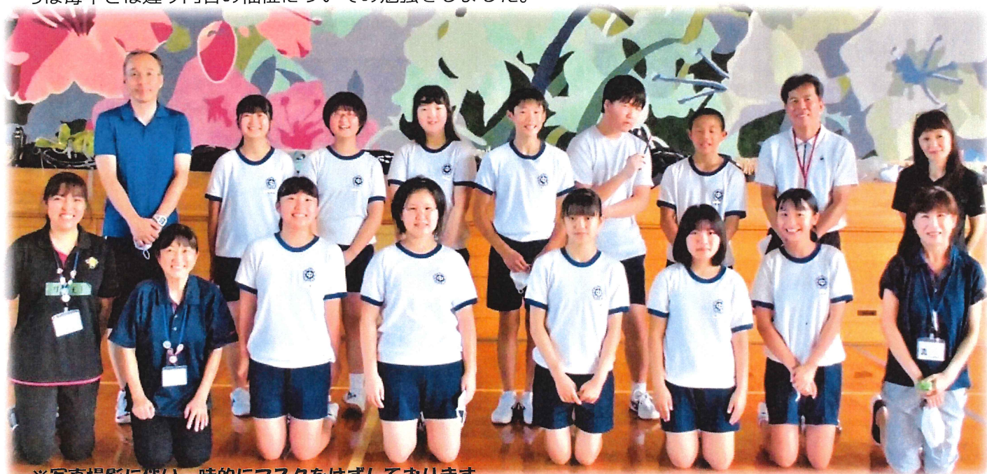
※写真撮影に伴い一時的にマスクをはずしております

毎年なら2日間開催の予定ですが、今年度は短縮の半日のみ。短い時間ではありましたが、生徒たちは毎年とは違う内容の福祉についての勉強をしました。