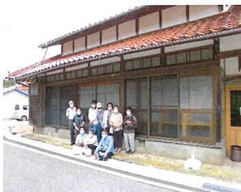
まるばらまちラボラトリー にお出かけ