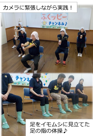
カメラに緊張しながら実践!