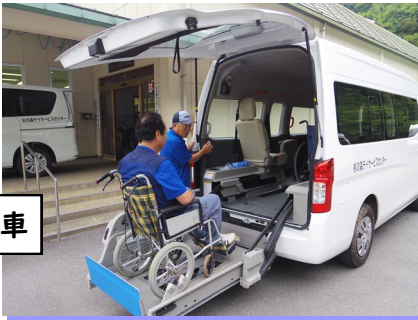
リフト付き送迎車

車いすご利用の方でもリフト付きの車輛で、ご自宅まで送迎します。（もちろん無料です。）