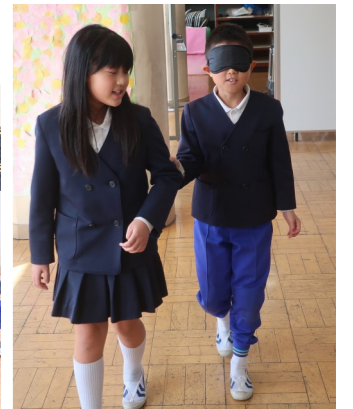
【ブラインドウォーク体験】