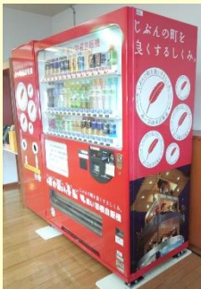
さんあいホーム(金城)にも設置されています。

浜田市共同募金会では、飲料メーカーのご協力をいただき、社会貢献型自動販売機による募金活動を推進しております。「赤い羽根」マークがついた自動販売機で飲み物を購入すると、飲料メーカー(協賛企業)からその売上の数%が浜田市共同募金委員会を通じて島根県共同募金会に寄付され、約7割が翌年度の浜田市の福祉活動や災害時のボランティア活動の財源として役立てられます。 企業や商店、施設や団体の皆さまには、設置者も購入者も社会貢献できる赤い羽根自動販売機の設置にご協力いただき、ますますようお願い申し上げます。詳細が知りたい方は浜田市社協旭支所まで、お気軽にお問い合わせ下さい。