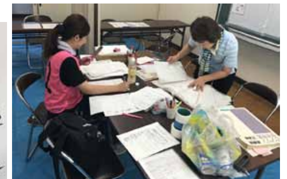
ニーズ受付班のようす