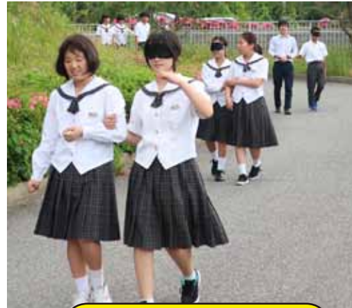
ブラインドウォーク体験