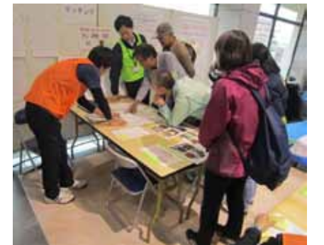
マッチング班(派遣調整)のようす

いつどこで発生するか分からない災害に備えて、普段からの地域との関わりを大切に誰もが安心して暮らすことができる地域づくりを推進していきます。