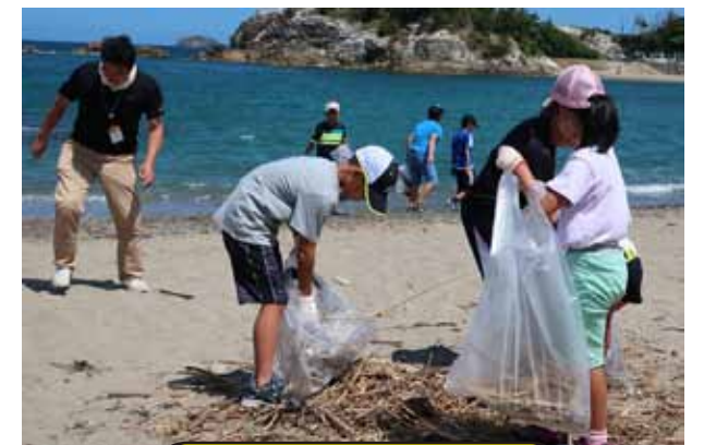
ビーチクリーン活動