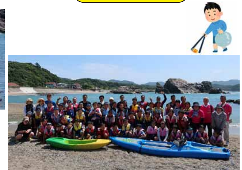
参加者全員集合写真