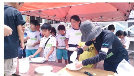
暑い中、炊き出し頑張りました