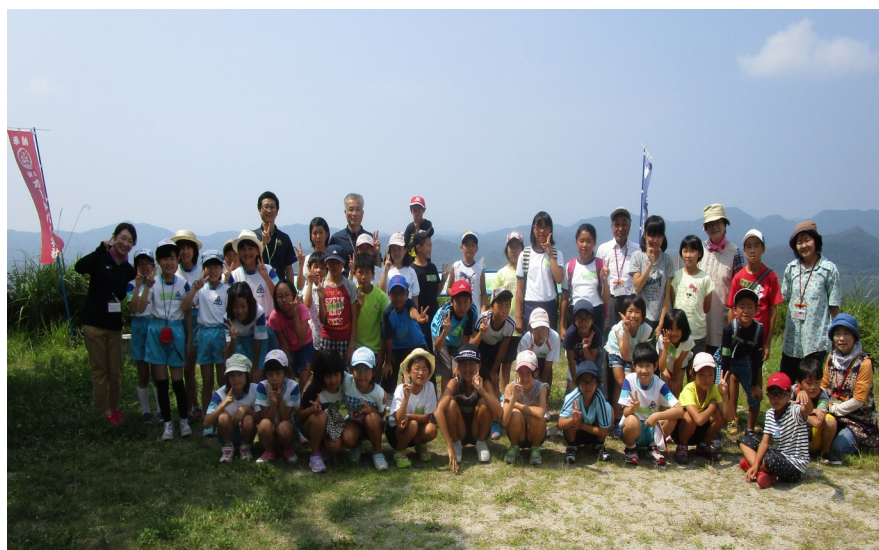
全員で、堂床山で記念写真♪夏休みの思い出になりました