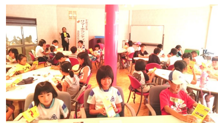
ホースセラピーについて学びました