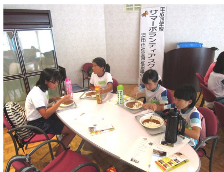
自分で袋詰めしたご飯はおいしいね