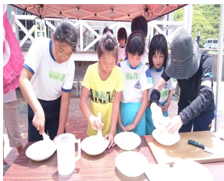
上手に炊けたかな