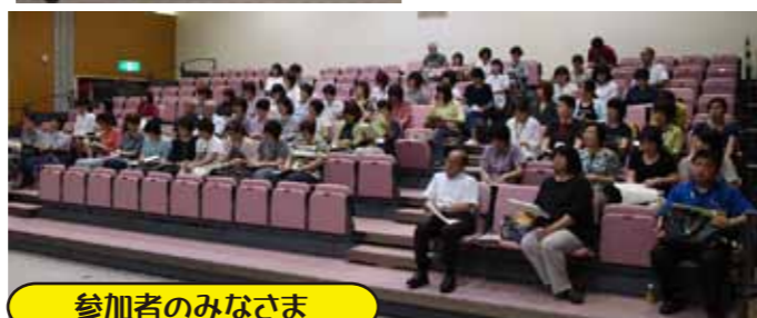
参加者のみなさま