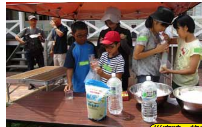
災害時の炊き出し体験・試食

みんなで炊き出し体験を行ったあと、ライディングパーク内を見学・餌やりや乗馬体験など、馬とのふれあいを通じて、心のやすらぎが生まれ、馬の世話をすることで責任感や協調性を身につけることができる効果がある「ホースセラピー」について学ぶことができ、貴重な1日となりました。