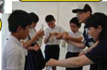
日赤 炊き出し訓練