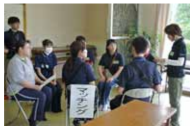
災害ボランティアセンター設置訓練

いつ起こるか分からない自然災害に備えて、「自分でできること」「家族でできること」「ご近所と力を合わせてできること」などについて考え、常日頃から災害に備えておきましょう。