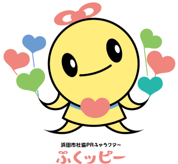
浜田市社協PRキャラクター