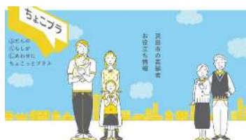
高齢者お役立ち情報 「ちよこプラ」情報公開