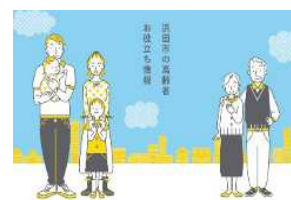
高齢者お役立ち情報 「ちょこプラ」