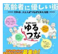
「ゆるやかなつながり」 チラシ