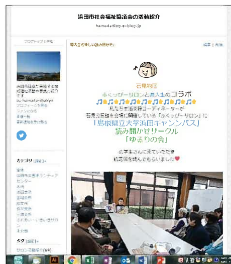
社協ブログの1ページ