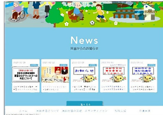
社協のホームページ