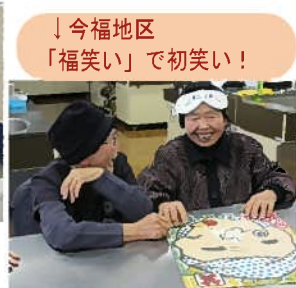
↓今福地区 「福笑い」で初笑い!