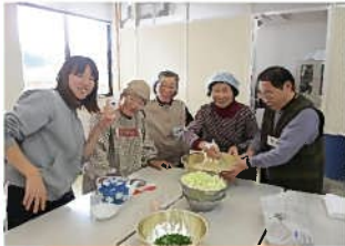
↑雲城地区 お好み焼きパーティー♥

介護予防事業として、3地区(今福・波佐・雲城)で月に2回ずつ実施しています。体操やゲーム、折り紙やカレンダーづくりなど、おしゃべりを楽しみながら毎回楽しく開催しています。新しい利用者さんも増えて賑やかになりました♪