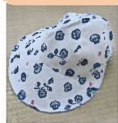
完成した手作り帽子

高齢者クラブの会員数は減少傾向にあります。このような活動を通し、高齢者クラブ連合会の三大運動『健康・友愛・奉仕』に取り組んでいます。