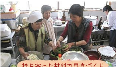
持ち寄った材料で昼食づくり

浜田市高齢者クラブ連合会弥栄支部では、2か月に1回女性部会を開催しています。女性会員