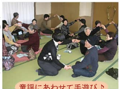
童謡にあわせて手遊び♪

「一人暮らし高齢者温泉の集い」を1月29日には岡見・黒沢地区、1月31日に三隅・井野地区、そして2月1日に三保・白砂地区の方を対象に温泉リゾート風の国にて開催しました。