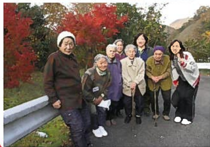
→波佐地区 ドライブでちよっと おでかけしました♪