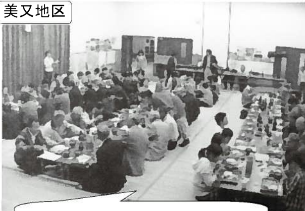
サロン交流会で地域がひとつに♪