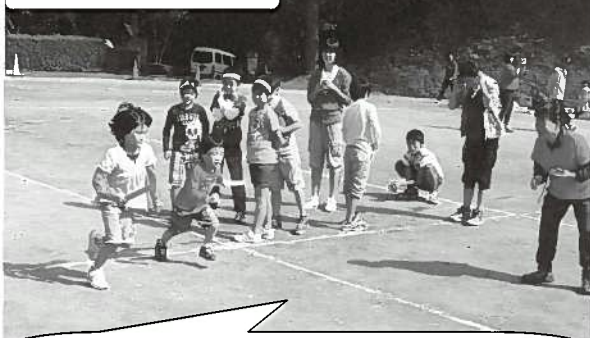
長見地区大運動会

全町民上げての運動会を開催しました。また、交流会を通じて親睦を図るため、軽スポーツ用具を購入しました。