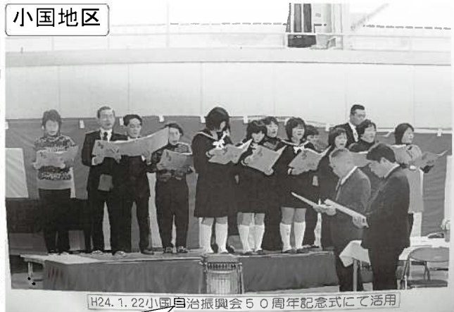
H24. 1. 22小国自治振興会50周年記念式にて活用