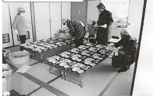
美川地区お節料理配食

「ふるまい向上」を推進するため、民生児童委員・児童・ボランティアなど94名が参加し、地域の連携を深めました。