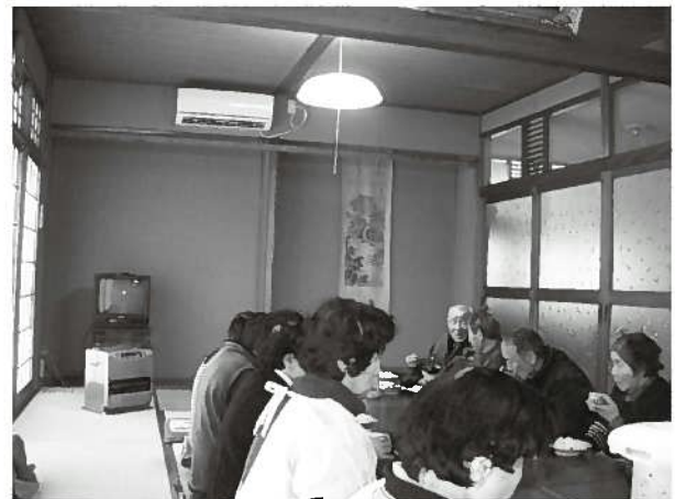
和田生活改善センターにエアコン設置