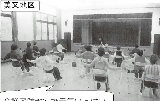
介護予防教室で元気いっぱい