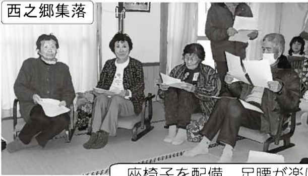
座椅子を配備。足腰が楽になり、集いやすくなりました。