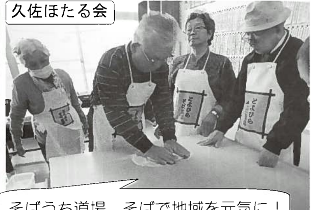
そばうち道場 そばで地域を元気に！