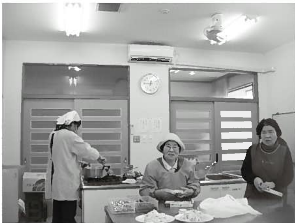
丸原センターにエアコン設置

全町民上げての運動会を開催しました。また、交流会を通じて親睦を図るため、軽スポーツ用具を購入しました。