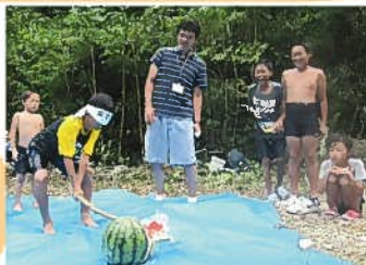
最後のお楽しみのスイカ割。見事にスイカを割り、みんなでおしくいただきました。