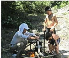
昼食はみんなでカレーライス作り。高齢者クラブの方に飯ごうでのご飯の炊き方や火のおこし方、野菜の切り方を教わりました。