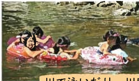
川で泳いだり、川にいる魚を探しました。

8月2日(木)、浜田市高齢者クラブ連合会 弥栄支部・杵束公民館・弥栄小学校の子ども達で川遊びを楽しみました。