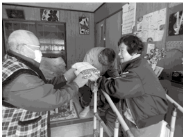
【歳末 声かけ訪問 お節配食】

令和3年10月1日からの赤い羽根共同募金、12月1日からの歳末たすけあい募金は、上記の実績となりました。