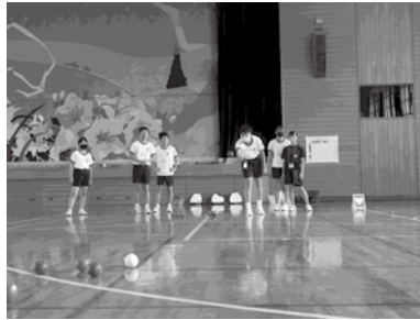
【旭 サマーボランティアスクール】