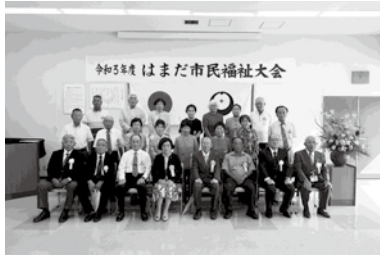
【はまだ市民福祉大会】