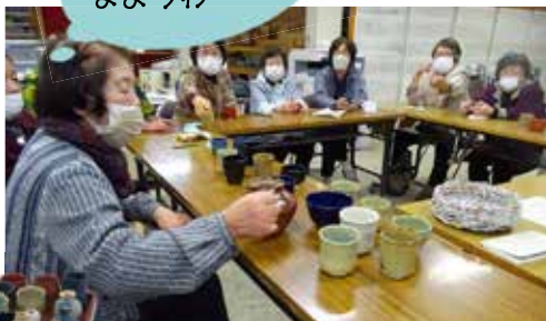
実は、どれも少しずつ違いますよ