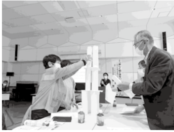
【三曙 サロンリーダー 研修会&交流会】