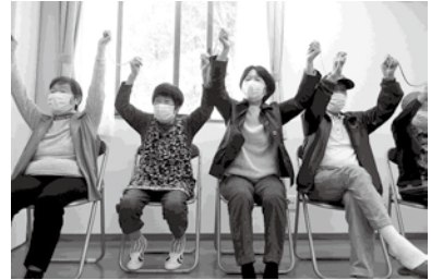
【ふくっぴーサロン】