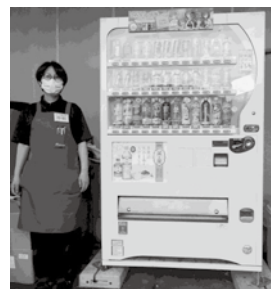
【キヌヤサンブラム店】