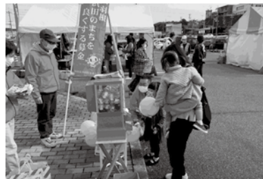
【BB大鍋フェスティバル】