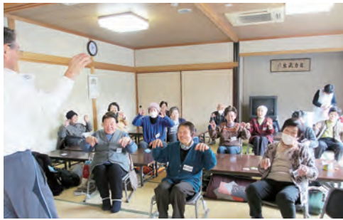
↑新春「福笑い」で初笑い！ ←体操も頑張ってます 寝たきりになっちゃあ やれんけんげえなく！