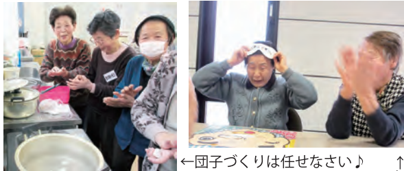
←団子づくりは任せなさい♪

介護予防事業として、6会場で月に2回ずつ実施しています。体操やゲーム、折り紙やカレンダーづくりなど、おしゃべりを楽しみながら毎回楽しく開催しています♪