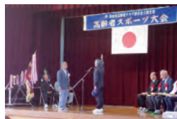
選手宣誓のようす 井野チームが見事に 3連覇を果たしました

スポーツ大会と言えば勝敗が気になるところですが、会場は和やかな雰囲気につつまれ、笑顔がいっぱいで会員相互の親睦が深まる大会となりました。