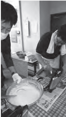
ワッフルづくりに 一生懸命

10月24日(土)、さんあいホームで開催した『第20回さんあい祭』に、昨年、入職10年未満の職員で結成した“浜田市社協未来塾”で喫茶コーナーを出店しました。