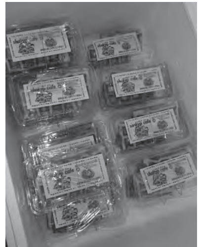
完成したワッフル

今後もこの会では、市内の各地域に出掛け、住民の皆さんに社協をより身近な存在に感じていただけることを目指し、活動していきます。