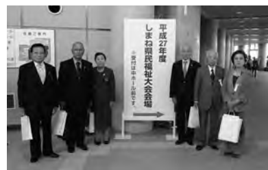
被表彰者(大会出席者)の皆様