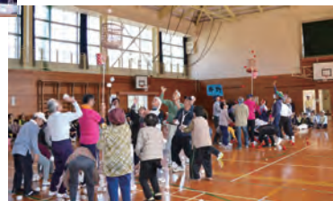
「玉入れ」のようす 入るとマイナス得点に なるカゴがあるので、 みなさん慎重です