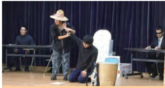
↑寸劇による わかりやすく楽しいご指導でした♪

今回は『絶対にダメされない!』をテーマに約40名が参加しました。浜田警察署の署員による講話と「警1(ケイワン)劇団」による寸劇により、ダメしの手口やダメされないコツ等を勉強しました。