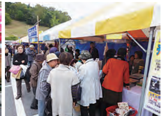
今年もバザーは大盛況!!