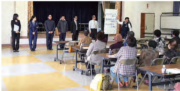
↑絶対にダメされないように! 注意点などお話しいただきました。