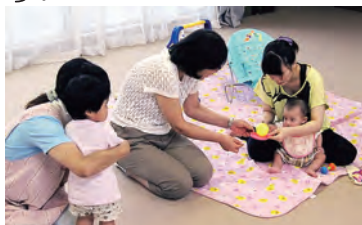
みんなで輪になってボール渡し。落とさずできたかな？