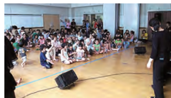
ブラックパネルシアター(会場を暗くする)の幻想的な世界にくぎづけ!

今回は、Candy・Basket(キャンディ・バスケット)の皆さんの音楽を組み合わせたパネルシアターを体感。その後、民生児童委員さんとの大玉とお手玉を使ったふれあい遊び、たこ焼きなどの手作り出店があり、150名の親子が盛りだくさんの一日を過ごしました。