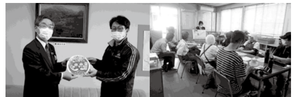
【左：JAでのステッカー贈呈式のようす】 【右：コーヒン商会での講義のようす】

浜田市社会福祉協議会では、「ゆるやかな見守り」を地域に広げていくため、町内会やサロン、企業や法人等において、出前講座として講義を行っています。企業の地域貢献としても関心を持っていただく事業所も徐々に増えてきている中、社員や地域への意識啓発のため、受講後に公用車(社用車)等に貼っていただけるステッカーを作成し、ゆるやかな見守りプロジェクトにご協力をいただいています。「ゆるやかな見守り」について、話を聞いてみたい等ありましたら、ぜひ！お声掛けください！