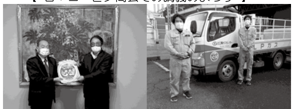
【左：三隅ガスセンターでのステッカー贈呈式のようす】 【右：社用車にステッカーを貼ってもらいました♪】