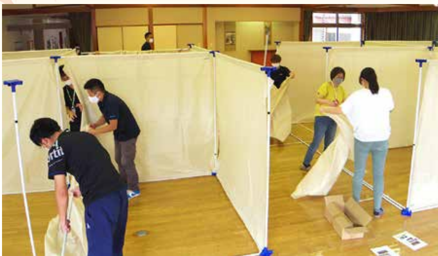
世帯別の生活空間の確保や感染防止対策のための仕切りを設置しています