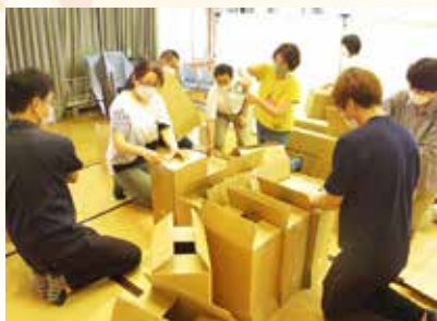
↑段ボール製簡易ベッド 組み立て中