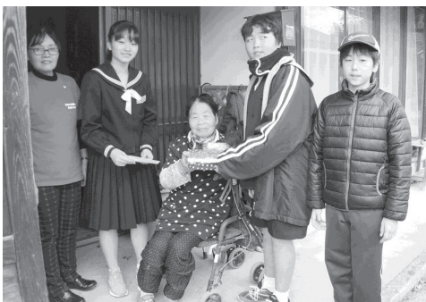
歳末安否確認声かけ訪問「まごころ弁当」(金城)

10月1日からの赤い羽根共同募金および12月1日からの歳末たすけあい募金は、上記の実績となりました。