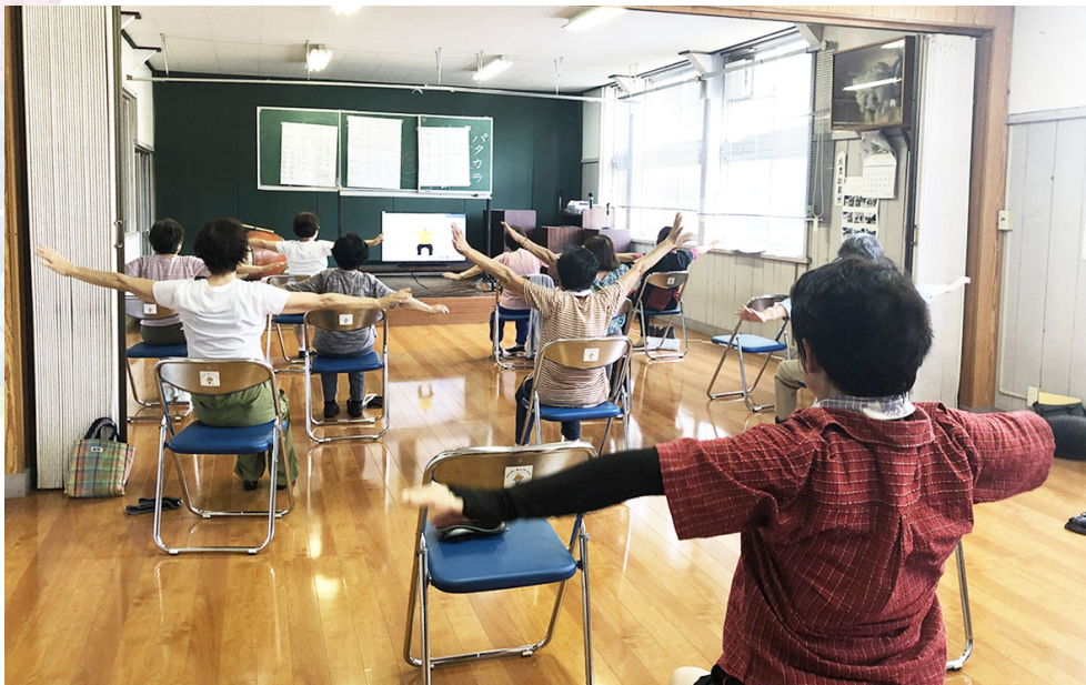
【久代らんらんサロン いきいき百歳体操のようす】

フレイルとは・・・「加齢により心身が老い衰えた状態」のことです。高齢者のフレイルは、生活の質を落とすだけでなく、さまざまな合併症も引き起こす危険があります。