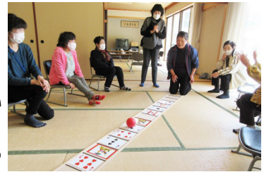
真剣に取り組みます♪