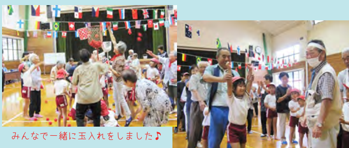
みんなで一緒に玉入れをしました♪

地域の高齢者の皆さんの健康づくりと親睦を深めることを目的に赤組白組に分かれ、全10種目を行いました。当日は、杵束・安城保育園の園児さんも含め総勢74名の参加となり、世代を超えたふれあいを楽しみました♪