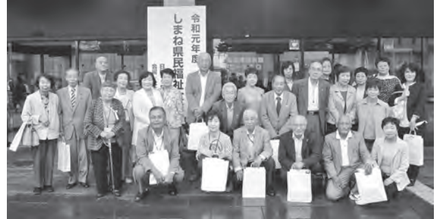
(※表彰者 順不同・敬称略)