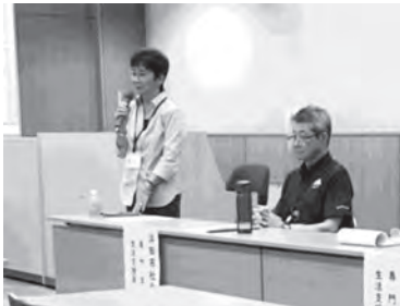
【活動報告のようす】

9月10日(火)、いわみーるを会場に、島根県社会福祉協議会主催の標記研修会が開催され、全体で86名、浜田市からは16名が参加しました。