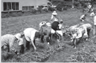
玉ねぎ、とれたどぁ～♪