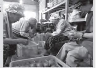
みんな楽しく、皮剥き作業