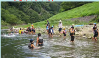
川で泳いだり、川にいる魚を探しました♪