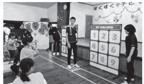
↑【ストラックアウト】…目指せBINGO!!

未来塾では、今後も地域イベントに出掛け、住民の皆さんと交流を深めるとともに、社協事業のPRも行なってまいります。地域イベントで見かけた際には、ぜひお声掛けくださいね♪