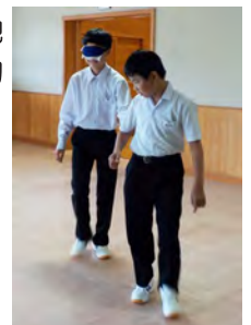
ブラインドウォークのようす

今後、あいサポーターとして、地域により一層、優しさを広げる活動をされることを期待しています!