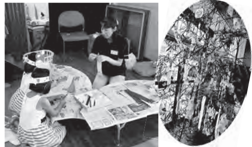
↑【七夕飾りづくり】…みんなの願い事が叶いますように!!