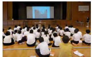
障がいについて理解を深めました

7月1日(月)、生徒41名が総合的な学習の時間として、あいサポート研修とブラインドウォーク(アイマスク)体験を行いました。