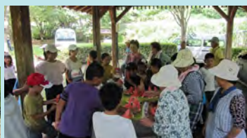
最後に、スイカをみんなでおいしくいただきました