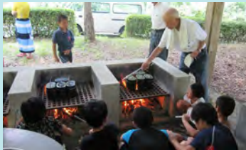
美味しいご飯が炊けました♪

7月30日(火)、道猿坊公園を会場に小学生30名が参加し、会員12名と公民館や児童クラブの協力で川遊びを楽しみました。