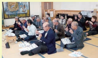
手話を学びました

高連三隅支部では毎年1回、会長・女性部・若手部会員が一同に集まり、情報交換や研修を行っています。今回の研修では、12月14日(金)、障がいの特徴や必要な配慮について学ぶ「あいサポーター研修」を開催しました。会員さん方にはこれからもより一層、温かなまちづくりを進めていただけることと期待しています!