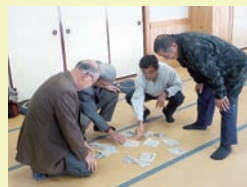
新聞パズルを楽しみました♪