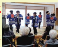
三隅さんまんかを踊りました♪

イサービスセンターへ訪問しました。この日は偶然にもクリスマスの日、会員さん方の心のもった手作りクッキーがプレゼントになりました。