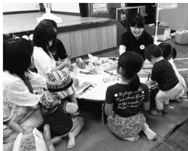
【七夕創作コーナー】