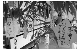
願い事が叶いますように♪