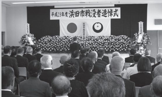
昨年の追悼式の様子