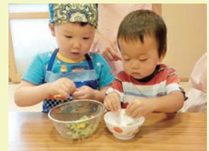
ホットケーキミックスに夏野菜や桜えびを入れて、アイデアたくさんのパンケーキができました♪