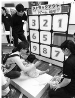
【ストラックアウト】

これからも、未来塾では、市内の行事や地域イベントに出掛け、市民の皆さまと身近な関係づくりをすすめることを目的に社協のPR活動に努めて参ります。