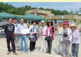
今福チームのみなさん