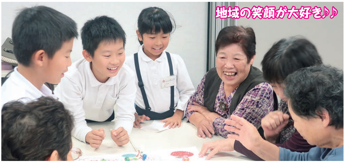
地域の笑顔が大好き♪♪