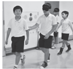
【ブラインドウォーク体験】

体験をとおして、職員に「福祉の仕事で嬉しかったことはなんですか」の質問があるなど、福祉について理解と学びを深めることができました。