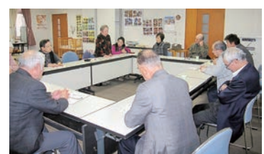
胸の内を語られました