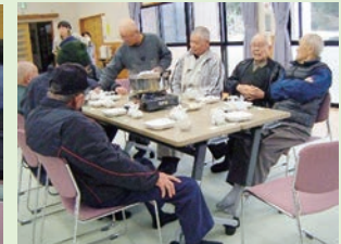
↑おいしい「おでん」をいただきました♪