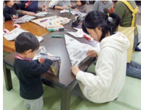
↑鬼面の帽子でパチリ♪