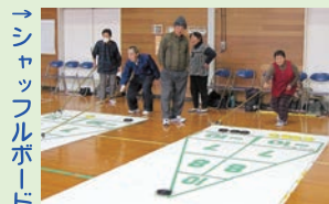
→シャッフルボード