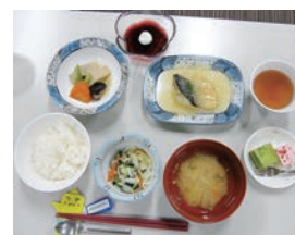
↑優しい味付けの昼食♪