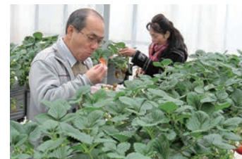
↑甘いいちごに皆さんリフレッシュ♪

試食後には献立の感想や、日ごろ介護をしている中での悩みや困りごとなどを自由に語り合い、「頑張り過ぎない介護」の言葉を胸に帰路につきました。