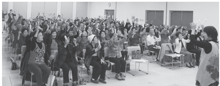
研修 『音楽で楽しく健康に』