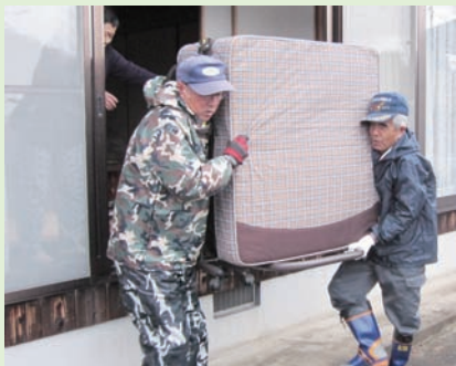
2人で力を合わせて運び出します!!