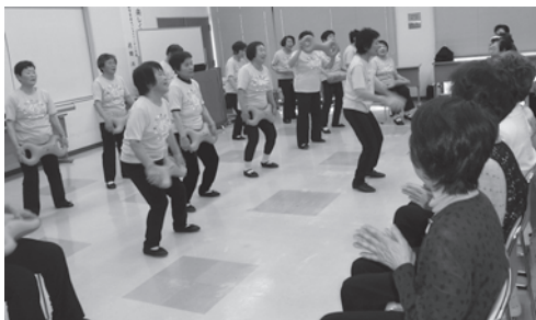
上府長寿会 ニコニコ会 『3B体操』