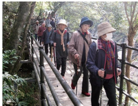
川のせせらぎを聞きながら、景観を楽しみました!!