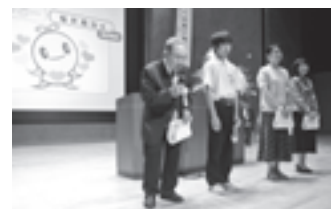
PRキャラクター表彰式の様子↑

今後少しずつではありますが、社協だよりをはじめ、様々な場面で登場していきますのでよろしくお願ひします。