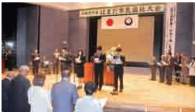
↑市民憲章唱和（島根県立大学BBSサークル）