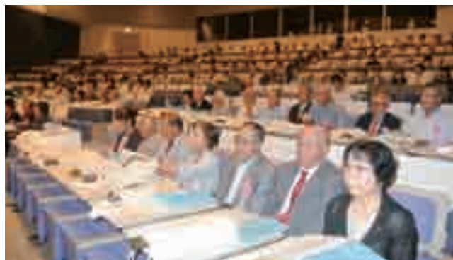
↑たくさんのご来場ありがとうございました。

8月27日(土)、島根県立大学講堂を会場に、表彰者を含め約270名のご来場をいただきました。