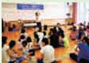
↑音楽に合わせて動物に変身♪

音楽で遊んだ後は、旗取りやRDチャレンジ(的当てゲーム)、最後は出店で楽しみ、夏休みの良い思い出となりました。