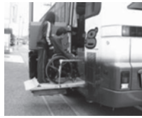
※リフトバスのイメージ画像

『障がい者の旅』を開催します。 移動は車いすの方にも安心なリフト付バスです。 みなさまのご参加お待ちしております。