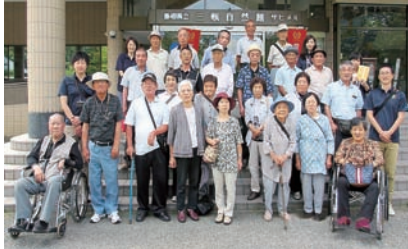
↑サヒメルの前で記念撮影♪

7月27日(水)、三瓶自然館サヒメル～西の原で三瓶山を間近に見上げ、多岐のいちじく温泉で昼食交流会をしました。再会を喜び合い、話は尽きないようで、賑やかなバスの旅となりました。